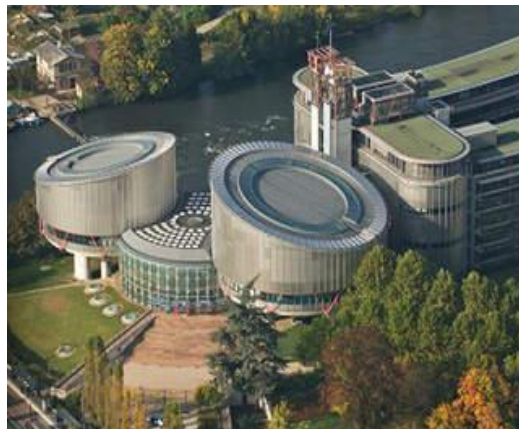
Figura nr. 3